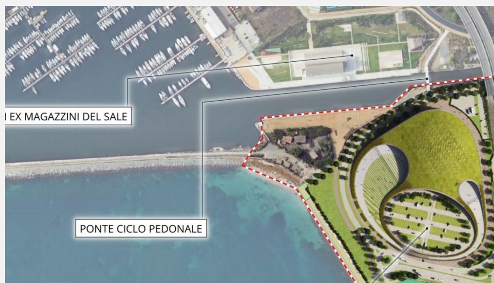
Fig. 1 "connessione ponte ciclopeditonale - Via Vespucci"

A tal fine, si prevede la conversione in viale, a prevalente funzione ciclopeditonale, del tratto finale di via Vespucci e la creazione di uno spazio pubblico dedicato alla socialità e al collegamento tra il lungomare e la struttura del nuovo Palazzetto dello sport, in prossimità della testata del Parco degli Anelli.