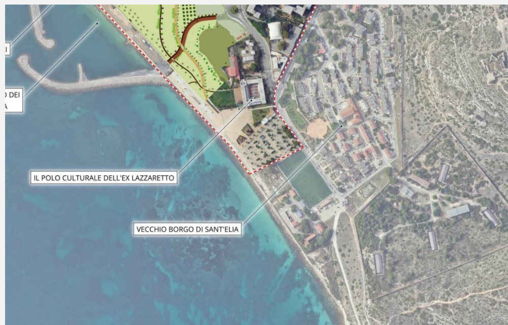
Fig. 2 "connessione Lungomare – Piazzale Lazzaretto

quindi, permette, l'implementazione di un vero e proprio percorso pedo-ciclabile che partendo dal Ponte Ciclopedonale giunge fino al Piazzale Lazzaretto, con l'obiettivo di favorire la mobilità lenta.